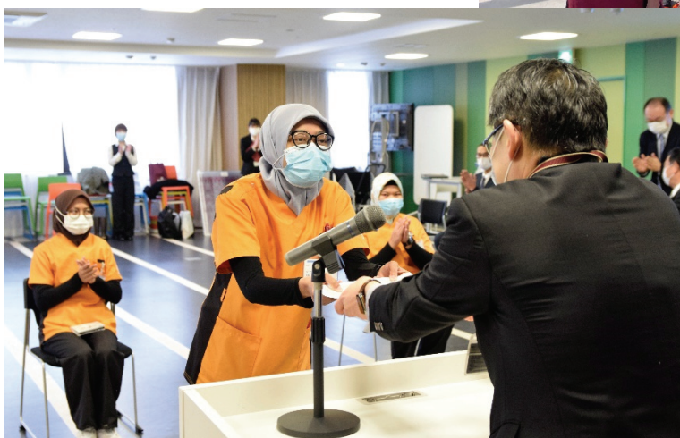
2021.1.8 インドネシア人実習生 辞令交付式