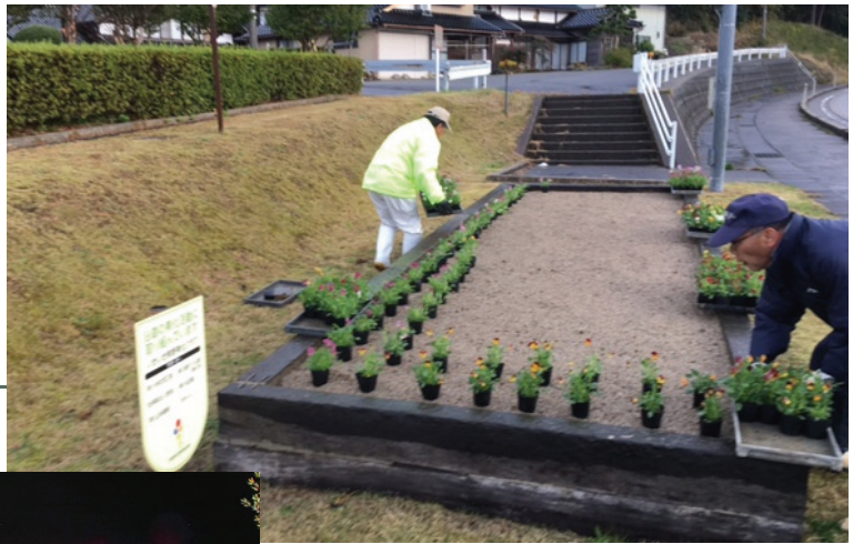
2020.11.14 石川県精育園 地域連携沿道環境創出事業 (いしかわ我がまちアドプト制度) 花苗植栽