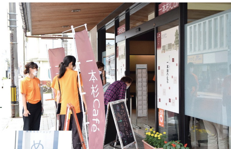
2020.7.1 けいじゅ一本杉 一本杉Café 再開