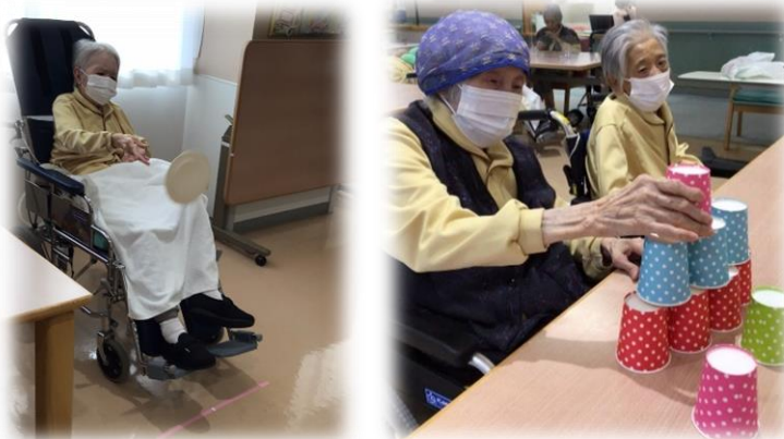
3F:フライングディスク 2F:スタッキングタワー