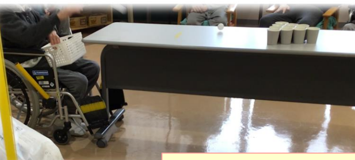
4F:ピンポンカップイン

「私もやりたいわあ」「もう一回させてくれま。」と積極的な声が多く聞かれました。結果は次の通りとなりました。